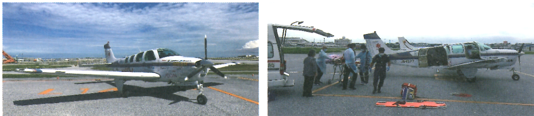
特定非営利活動法人メッシュ・サポート

メッシュ（MESH）は2007年より離島・僻地の医療格差改善を図るため、多くの方々からの支援を財源に航空機を用いた医療支援活動に取り組むNPO法人です。